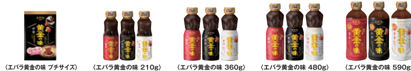
(エバラ黄金の味 チキサイズ) (エバラ黄金の味 210g) (エバラ黄金の味 360g) (エバラ黄金の味 480g) (エバラ黄金の味 590g)