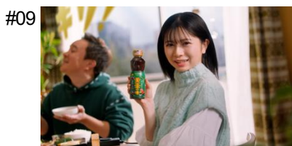
桜田さん 「つまり、 新しいうまさ！」