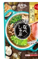
あさりと帆立の貝だしつゆ