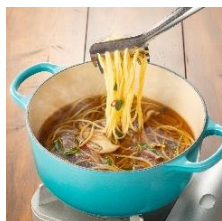
おすすめメパスタ