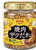
焼肉ザクだれ 塩だれガーリック

本商品は、具材自体に塩だれ風味の味わいをまとわせる新たな製法により、具材そのものに味を感じられる品質に仕上がっています。たれの水分量を減らしてオイルを合わせることで、ザクザクとした食感を実現しています（特許出願中）。開発背景は、おうち焼肉を盛り上げるために調味料で何ができるかさまざまな切り口で検討した中で、いつもの焼肉に食感をプラスする「食感変調味料」というアイデアが生まれました。