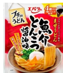
魚介とんこつ醤油味