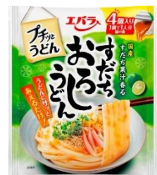
すだちおろしうどん