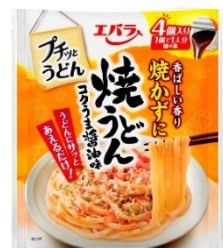
焼うどん コクうま醤油味