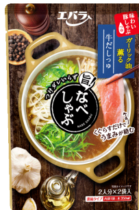
なべしゃぶ 牛だしつゆ

本醸造しょうゆと昆布だしをベースにユズ・スダチ果汁のさわやかな風味を合わせました。ごま油が香る、さっぱりとしたコクのある味わい。