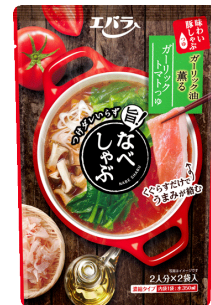
なべしゃぶ ガーリックトマトつゆ

牛だしと香味野菜のうまみをベースにブラックペッパーを効かせました。ガーリック油が香る、コク深くやさしい味わい。