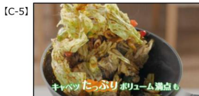
原さん) キャベツたっぷり、 ボリューム満点も、