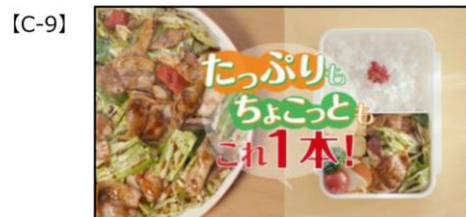
NA) たっぷりも、 ちょこっとも、 これ一本！