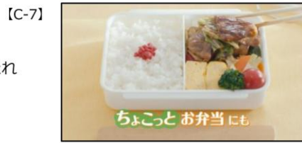
お弁当に ちょこっと使いも、