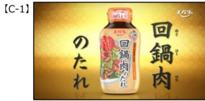
サウンドロゴ) エバラ「回鍋肉の」たれ