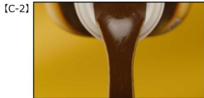
NA) この「たれ」が おうちの中華を