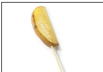
●北海道 ポテトバー