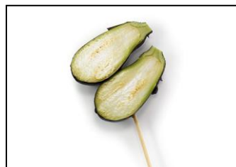
●新潟県 十全なすバー