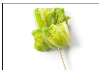
●大分県 ゆず白菜バー