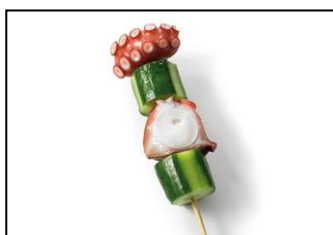
●兵庫県 たこキューバー