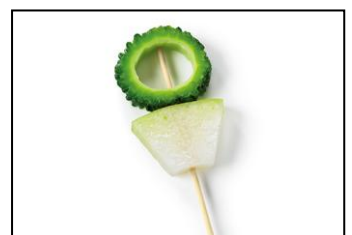
●沖縄県 冬瓜ゴーヤーバー