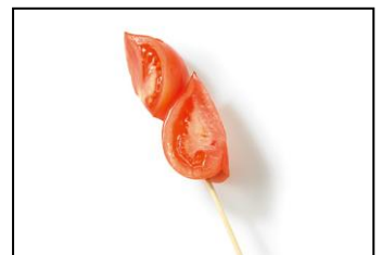
●愛知県 ファーストトマトバー