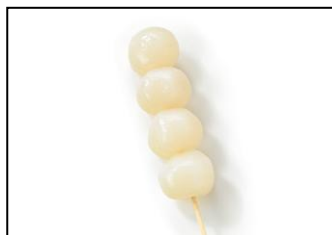
●山形県 たまごんバー